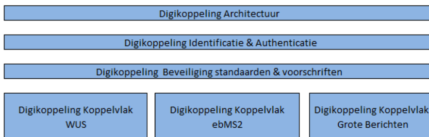
Figuur 1: Onderdelen digikoppeling specificatie

De onderstaande figuur geeft de verschillende onderdelen van de digikoppeling standaard weer: