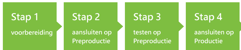
Figuur 2: Het aansluitproces bestaat uit vier stappen

Het aansluitproces beschrijft alle handelingen die u moet uitvoeren om met succes op Lopende zaken van MijnOverheid aan te sluiten. Het stappenplan bestaat uit vier stappen. Verderop vindt u de beschrijving daarvan.